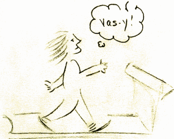
VENDEE Globe entre amis