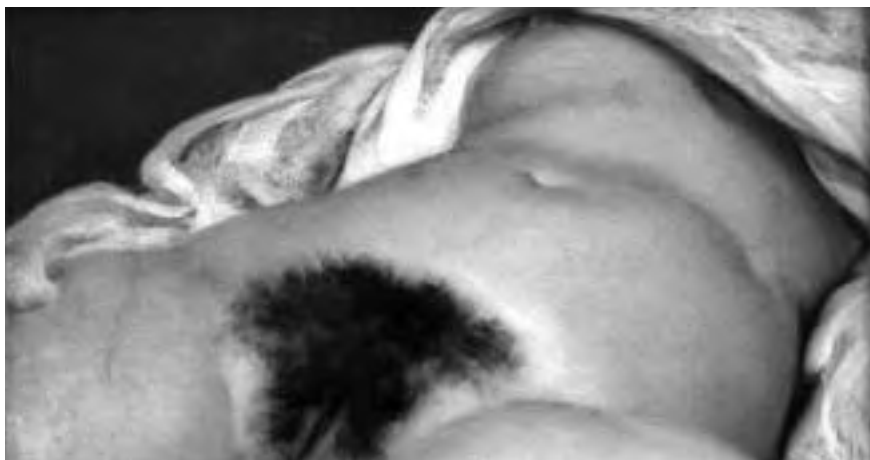
L'origine du monde (détail), Gustave COURBET, 1866. Tableau accroché en permanence au Musée d'Orsay, Paris.

Il est évident que l'impact de ces photos est lié au contexte et aux drames contemporains, alors