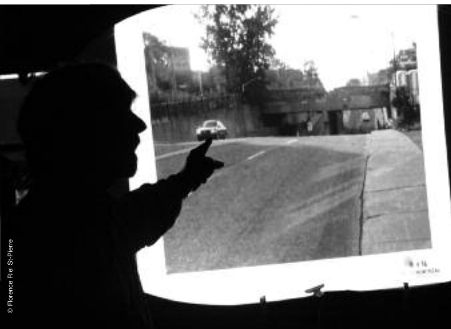
Luc Ferrandez à l'un de ses fameux "partys de trottoir" de la campagne électorale de 2009